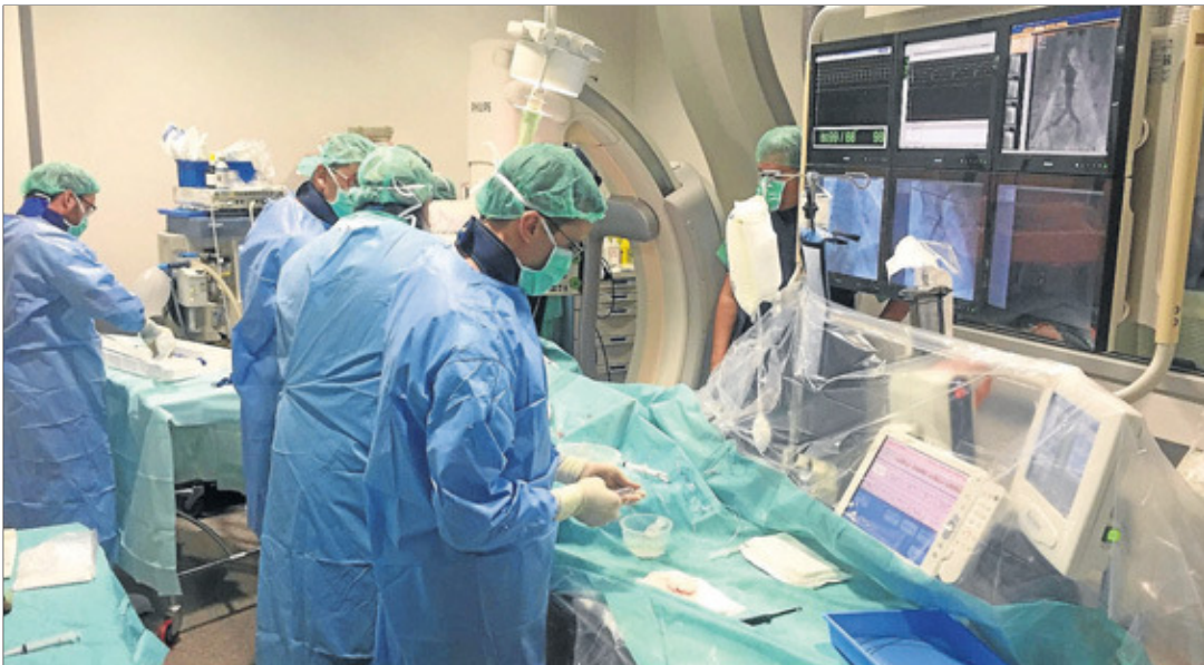
Equipo del HPS. El equipo de Hemodinámica intervino exitosamente a una paciente de 81 años con estenosis aórtica degenerativa severa.